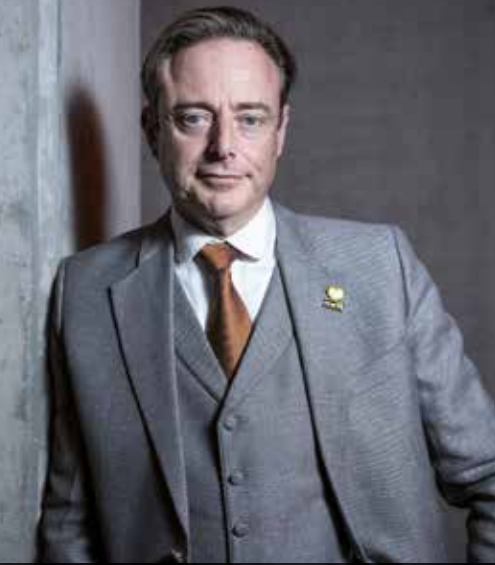
Bart De Wever | Burgemeester

“Antwerpen zal de slachtoffers van WO II nooit vergeten.