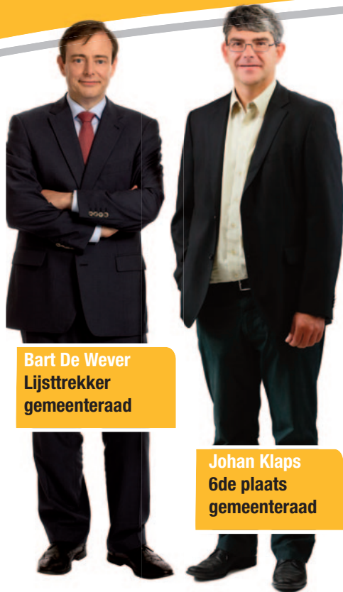
Bart De Wever Lijsttrekker gemeenteraad

Verkiezingsdrukwerken: gemeente- en provincieraadsverkiezingen 14 oktober 2012