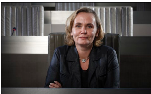
Vlaams Parlementslid Liesbeth Homans liesbeth.homans@n-va.be

Steeds meer Antwerpse kinderen volgen thuis les in plaats van op school. Dat kan omdat Vlaanderen leerplicht kent en geen schoolplicht. De cijfers die Vlaams Parlementslid Liesbeth Homans van Onderwijsminister Pascal Smet kreeg over dit huisonderwijs, deden echter haar wenkbrauwen fronsen.