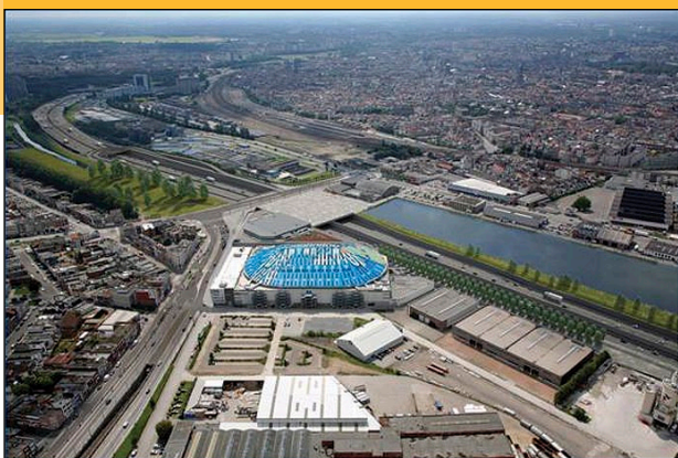
Het mobiliteitsplan is voor Antwerpen veel evenwichtiger uitgevallen.

Eindelijk is de knoop doorgehakt. De Vlaamse regering besliste over een nieuw mobiliteitsplan voor Antwerpen met een gesloten Antwerpse ring door middel van tunnels. De N-VA vreesde terecht dat dit duurder zou uitvallen en dat Vlaanderen niet langer bereid was de volle factuur op te hoesten. De stad moet mee voor de meerprijs opdraaien