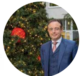
Bart De Wever Burgemeester

Ik wens u en uw naasten van harte een gezellig eindejaar en een fijn nieuwjaar toe, vol gezondheid en geluk. Draag zorg voor elkaar.