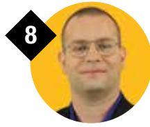
8 PORTAEL Jan 36 jaar Assistent-ploegleider BASF