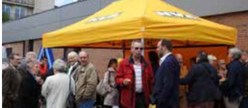
N-VA bezoekt alle wijken van Berchem p. 2