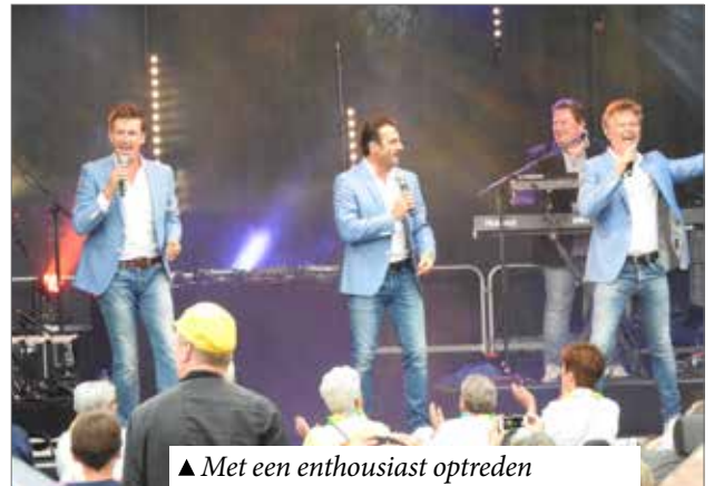
▲ Met een enthousiast optreden zweepen De Romeo's het publiek op.

Dat plein werd het voorbije jaar overigens volledig heraangelegd. Even vielen er enkele druppels, maar de rest van de avond konden we genieten van mooi weer. Het 11 julifeest begon met een drankje aangeboden door het district. Vervolgens sprak districtsburgemeester Evi Van der Planken. Nadien zweepen de Romeo's het publiek op met een enthousiast optreden. Het feest werd in schoonheid afgesloten op de beats van DJ Tournesol. N-VA Berchem was uiteraard aanwezig met een grote delegatie. We deelden petjes en leeuwenvlagjes uit om het Vlaams karakter van het feest extra in de verf te zetten.