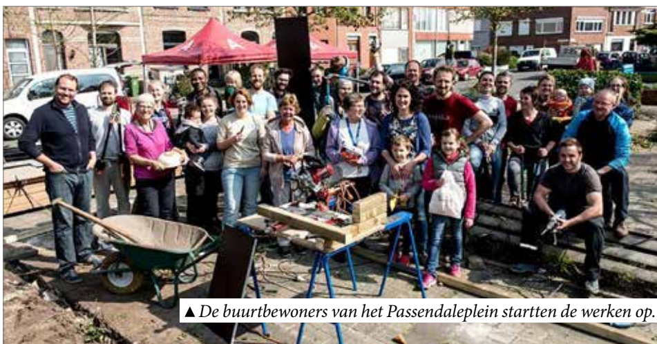
▲ De buurtbewoners van het Passendaleplein startten de werken op.

Voor de N-VA is burgerinspraak ontzettend belangrijk: het zit in haar DNA. Ook buiten de verkiezingsperiodes houden we de vinger aan te pols. We luisteren daarbij naar iedereen, ook naar wie minder mondig of minder mobiel is.