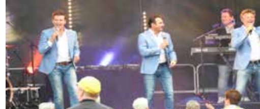
Vlaanderen feest p. 2